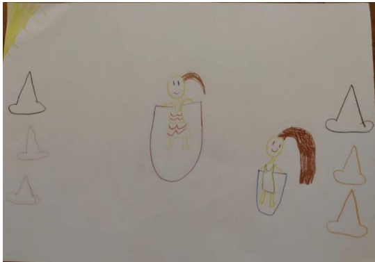
Elise Leal (zaklopen)