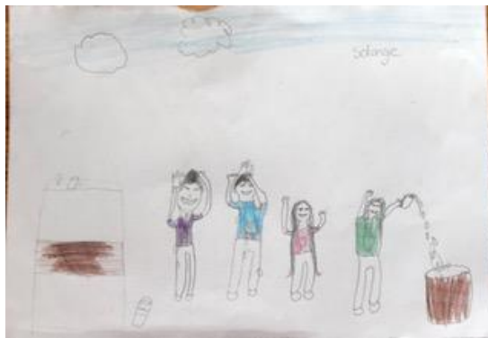
Solange de Swart (bekertjes waterspel)